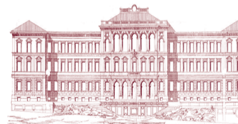
PRVA SUŠAČKA HRVATSKA GIMNAZIJA U RIJE